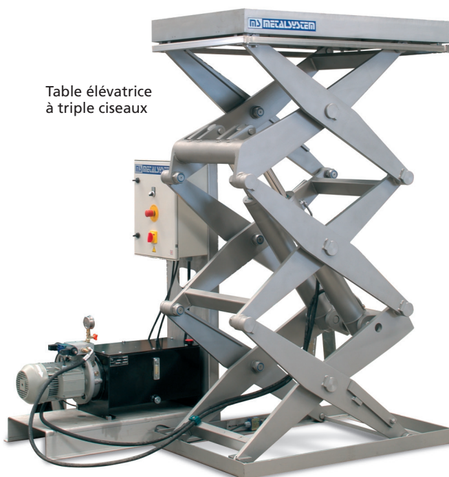
Table élévatrice à triple ciseaux