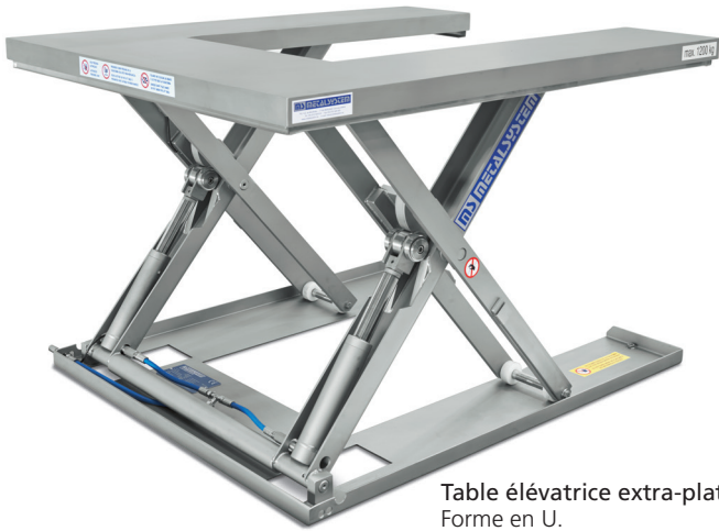
Table élévatrice extra-plate Forme en U.