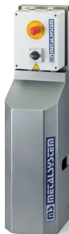
Pupitre de commande.