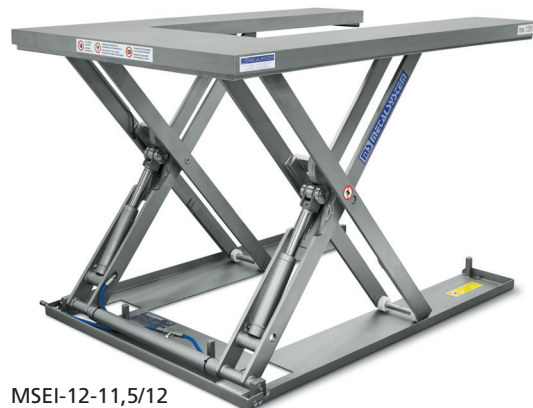
MSEI-12-11,5/12 Forme en U.