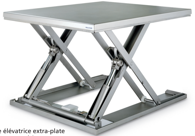
Table élévatrice extra-plate Forme rectangulaire.