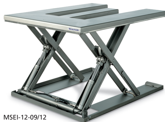
MSEI-12-09/12 Forme en E.