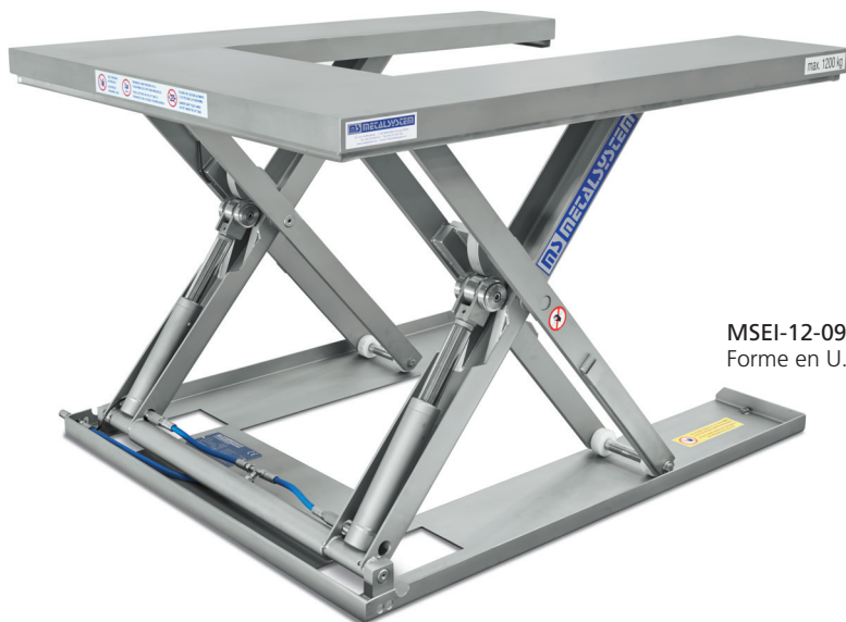
MSEI-12-09/12 Forme en U.