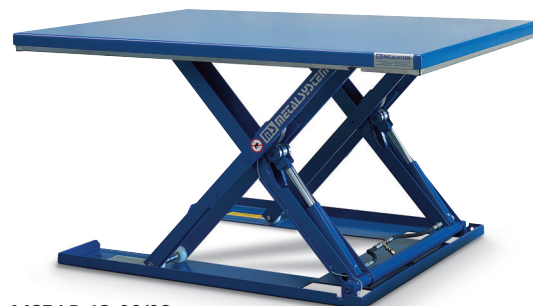
MSEAP-12-09/08 Forme rectangulaire.

TABLE ÉLÉVATRICE EXTRA-PLATE: Sa position repliée peu volumineuse permet une installation directement sur le sol, sans qu'il ne faille réaliser de fosse.