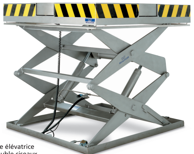
Table élévatrice à double ciseaux Avec plateau tournant.