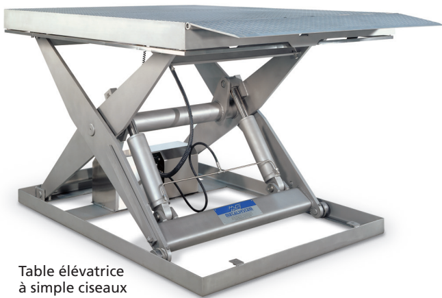
Table élévatrice à simple ciseaux Lèvre automatique.