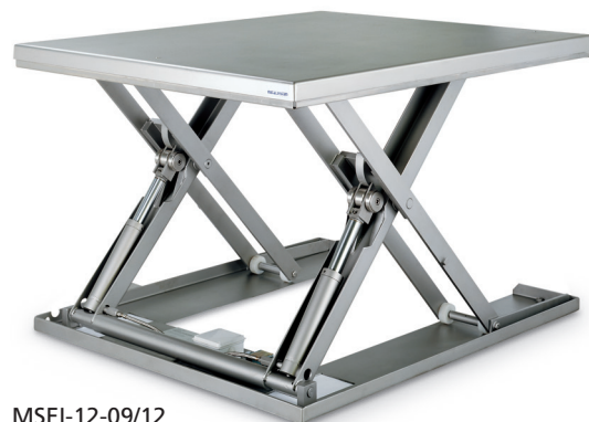
MSEI-12-09/12 Forme rectangulaire.