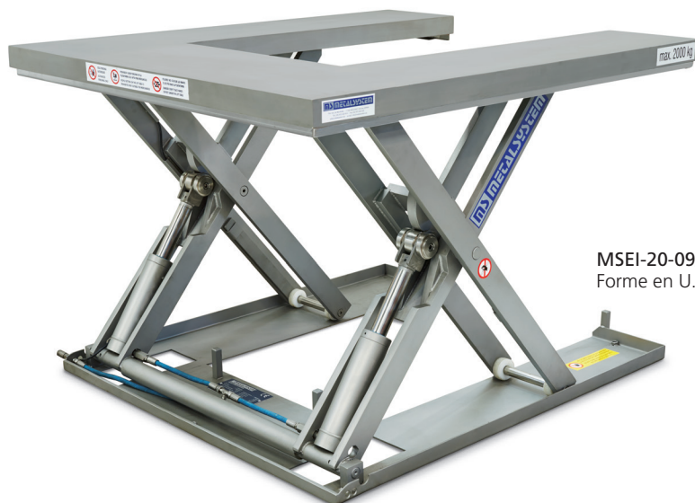
MSEI-20-09/12 Forme en U.