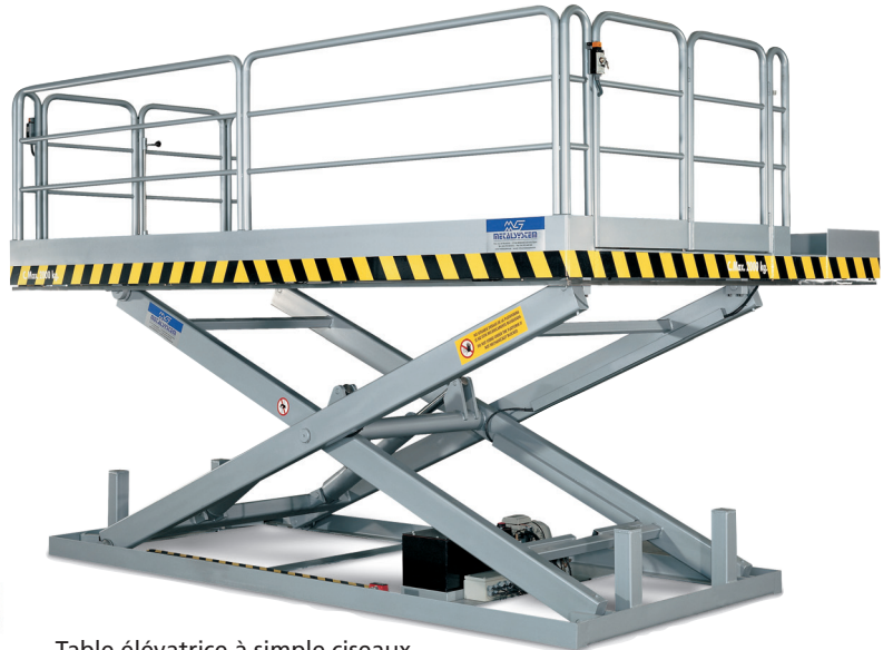
Table élévatrice à simple ciseaux Avec garde-corps et portes d'accès.